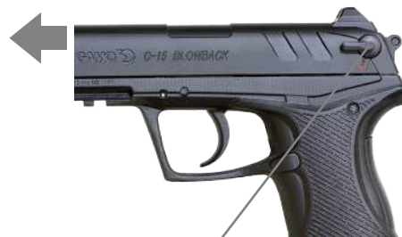
Cran de sûreté

Enclencher le cran de sûreté vers le haut, vers la lettre "F", un point rouge apparaîtra