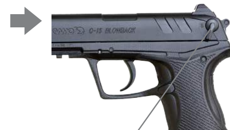
Cran de sûreté

Enclencher le cran de sûreté vers le bas, vers la lettre "S", le point rouge disparaîtra